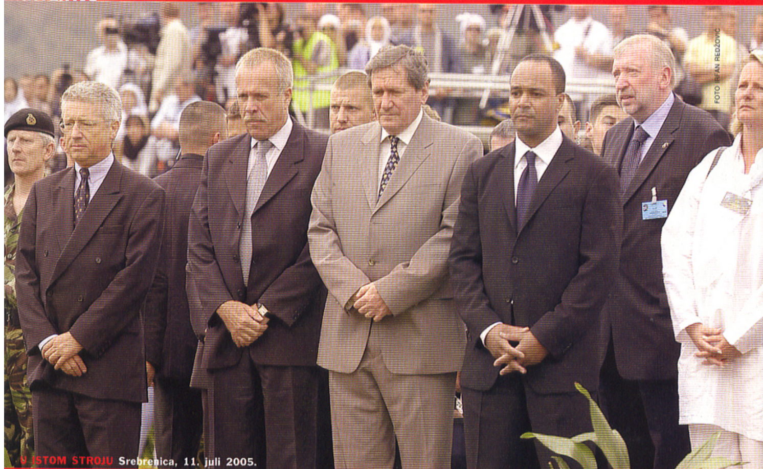
U ISTOM STROJU Srebrenica, 11. juli 2005.