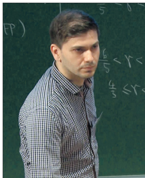
Hadžić: Dokaz da se može uspjeti zalaganjem i posvećenošću

Cijeli intervju s Wolfgangom Petričem pročitajte na portalu Avaz.ba