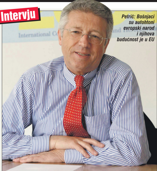
Petrič: Bošnjaci su autohtoni evropski narod i njihova budućnost je u EU